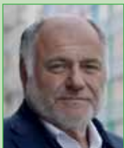
Rezzo Schlauch Rechtsanwalt und Parl. Staatssekretär a.D.