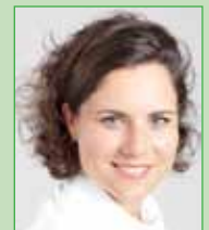
Julia Hauffe Green Avenue e.K.